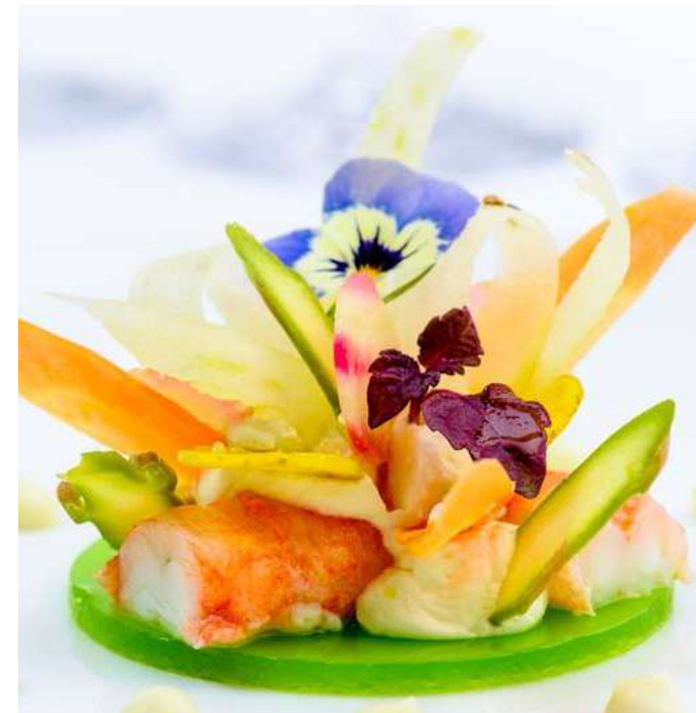
MONBLANC TRAITEUR Nombre d'invités: : pas de minimum